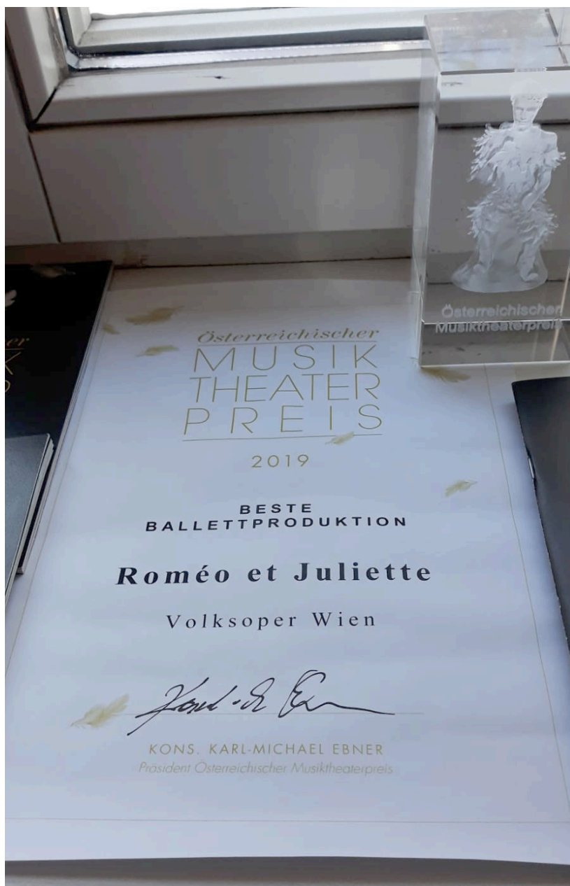
Best Austrian Ballet Production 2019 for "Roméo et Juliette" – Wiener Staatsballett